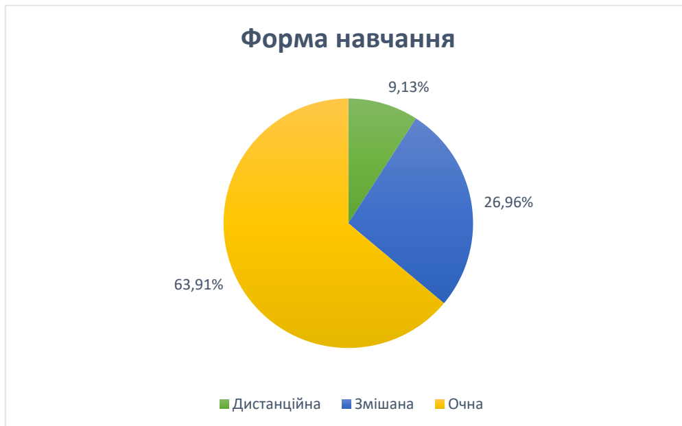
Рис. 1. Діаграма результатів анкетування здобувачів освіти щодо вибору форми навчання в умовах війни

Майбутні медсестри та фельдшери, як ніхто інший, розуміють, що практичні навички найкраще опановувати «вживу», у стінах коледжу, дистанційний формат найдоречніший для лекційних занять. У зв'язку з цим ще 26,96% опитаних обрали змішаний формат навчання (рис. 1).